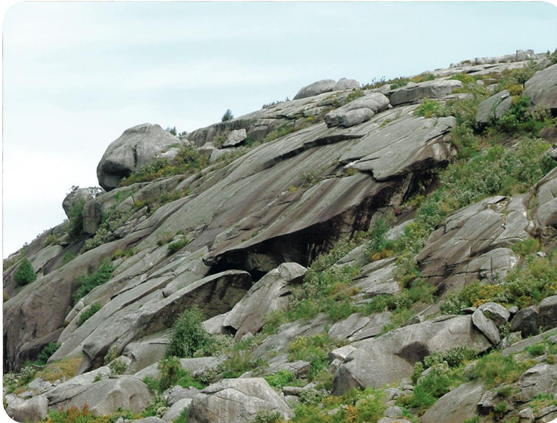
Granitos do Gerês

Paisagem geológica – Extensão de território dominada por um tipo de rocha , que lhe confere um aspeto característico quanto ao tipo de relevo, à qualidade dos solos, aos cursos de água e à distribuição dos seres vivos.